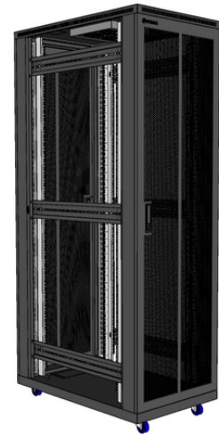
Bản vẽ tủ 42U D1000