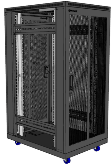
Bản vẽ tủ 27U D1000