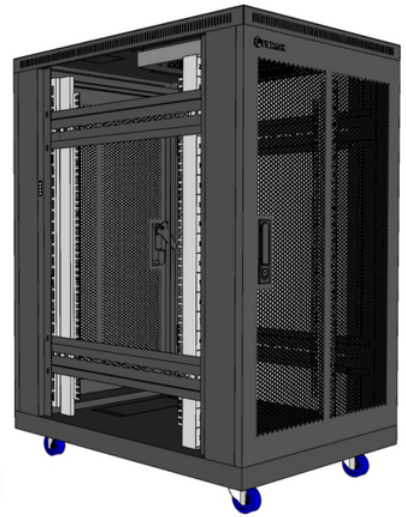
Bản vẽ tủ 20U D800